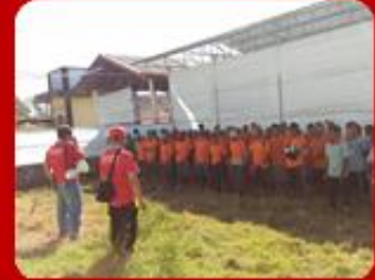
Memberdayakan Masyarakat Lokal