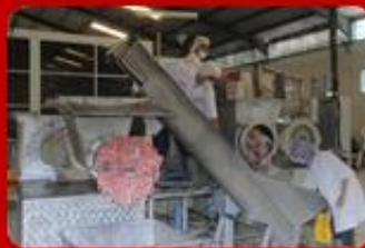
Pengolahan Daging Komet