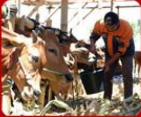
Hewan Qurban Pilihan