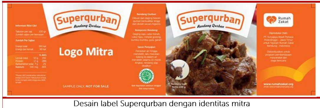
Desain label Superqurban dengan identitas mitra

Labeling merupakan display image korporat dalam kaleng Superqurban sebagai entitas social responsibility serta bagian dari Good Corporate Governance dari korporat tersebut. Ketentuan labeling berlaku bagi mitra dengan nominal kerjasama 40 Kambing atau 5 Sapi.