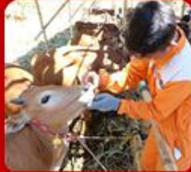
Pemeriksaan Hewan Qurban