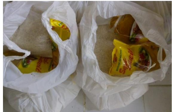
Isi Paket Fidyah