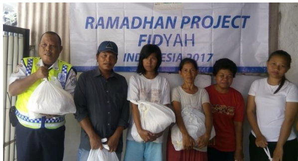
Penerima Manfaat Mendapatkan Fidyah