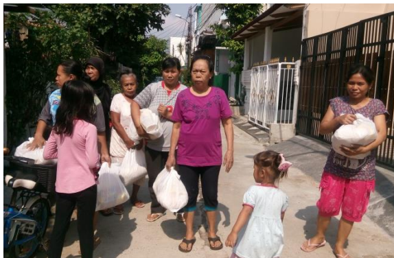
Penerima Manfaat Sudah Mendapatkan Fidyah