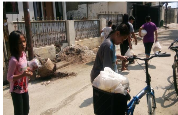
Penerima Manfaat Kembali kerumahnya Masing-masing