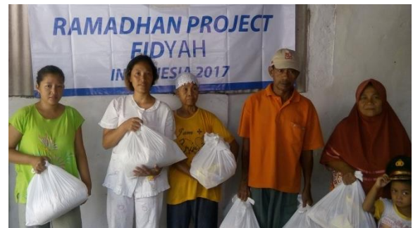
Penerima Manfaat Menerima Fidyah