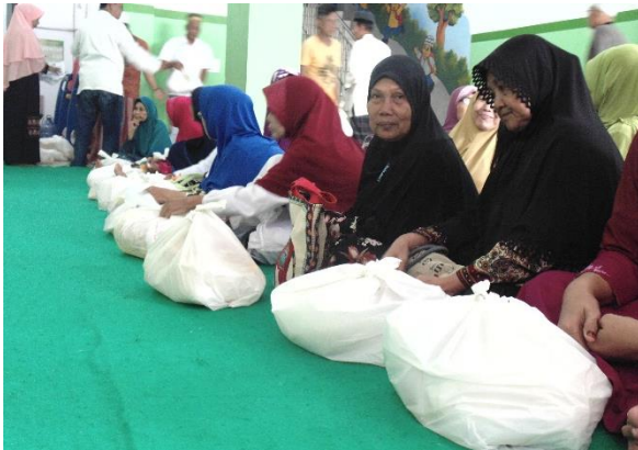
Pembagian Paket Zakat Fitrah