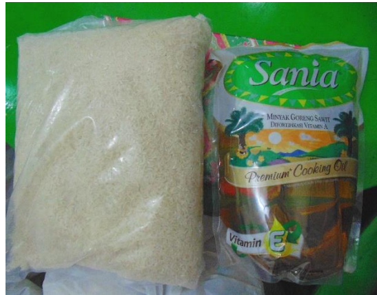
Isi Paket Zakat Fitrah