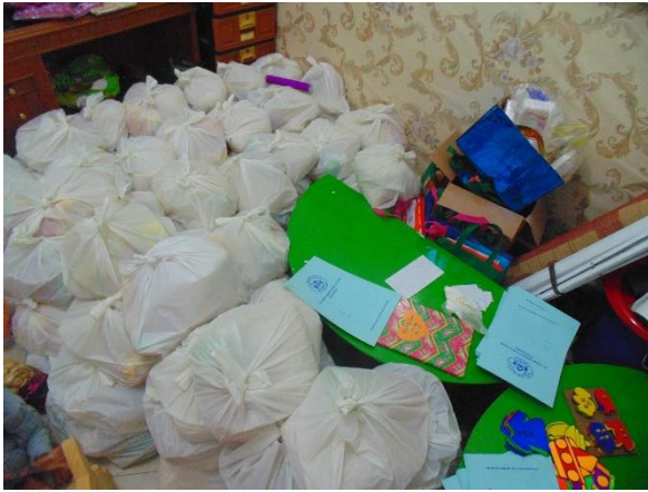
Paket Zakat Fitrah