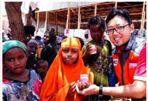
Penyaluran Superqurban untuk para pengungsi di Somalia