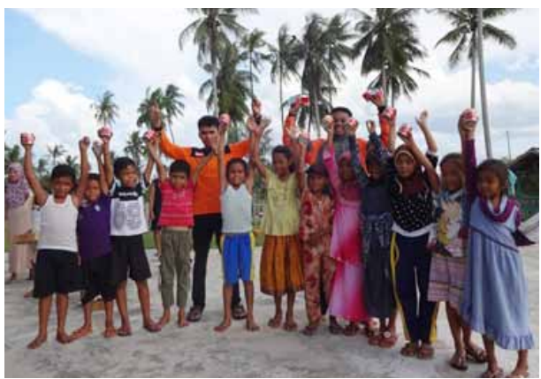
Ekspedisi Penyaluran Superqurban digelar di pedalaman Riau