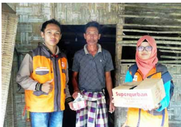
Penyaluran Superqurban untuk korban banjir di Lamongan