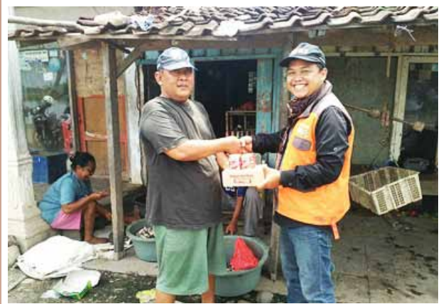
Penyaluran Superqurban untuk warga di Sidoarjo