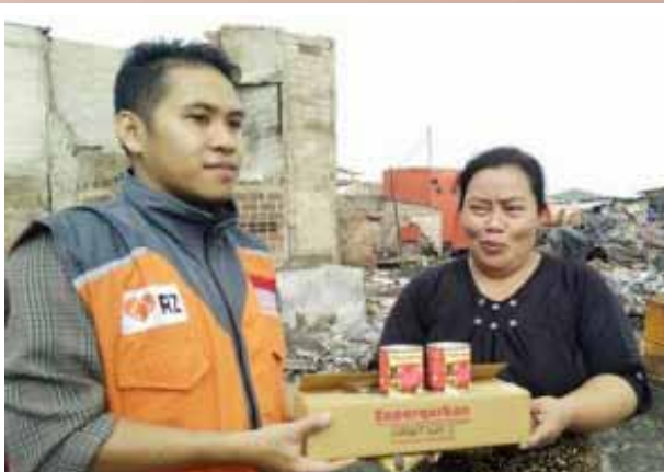
Penyaluran Kornet Superqurban untuk korban kebakaran Jakarta Utara