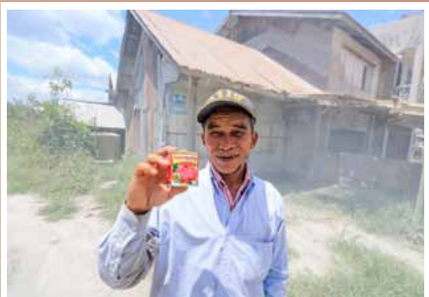
Penyaluran Superqurban untuk pengungsi korban erupsi Gunung Sinabung