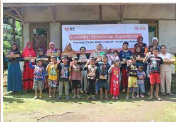
Penyaluran Superqurban untuk warga di pedalaman Sumedang