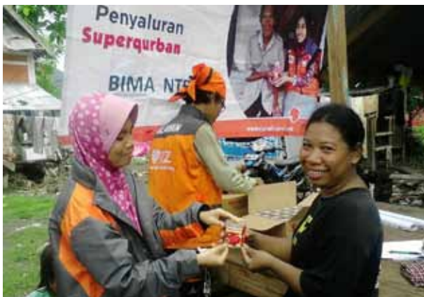
Penyaluran Superqurban untuk korban banjir di Bima Nusa Tenggara Barat