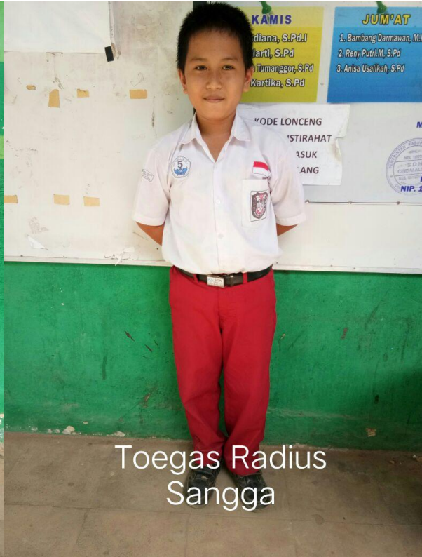
Toegas Radius Sangga